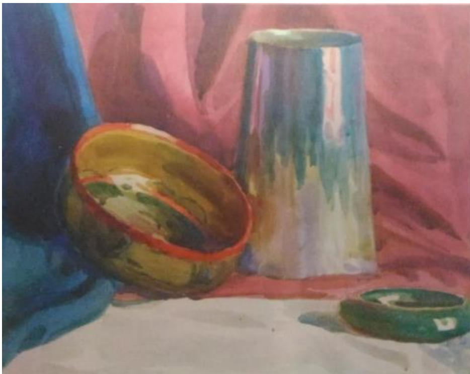
Рисунок 2.1 Пример работы по вступительному испытанию «Живопись»

Предъявляемые требования: Поступающий должен скомпоновать на листе бумаги рисунок натюрморта, точно передать взаимное расположение предметов, правильно определить их пропорции, верно передать характер, форму, материальность, цветовые и тональные отношения изображаемых предметов в пространстве в условиях дневного освещения.